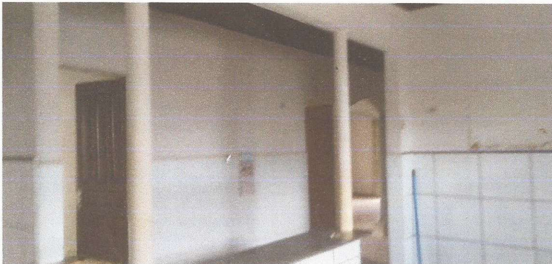
Foto interna I