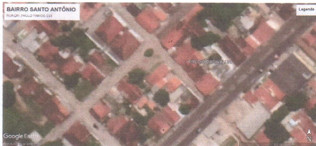
Figura 1 vista área do imóvel

Endereço: Rua Dr. Paulo Ramos, Nº 333, Bairro Santo Antônio, Carutapera - Ma