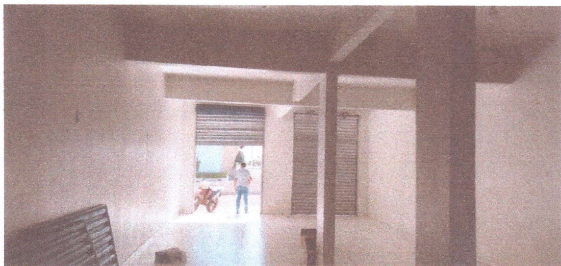
Foto interna III