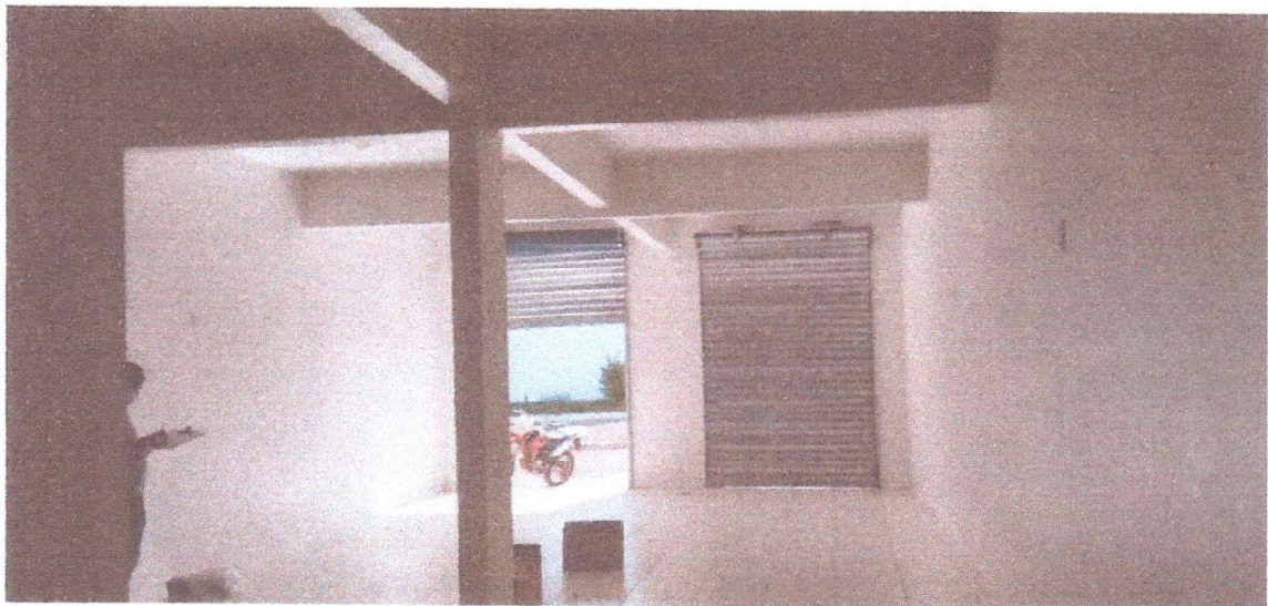
Foto interna I