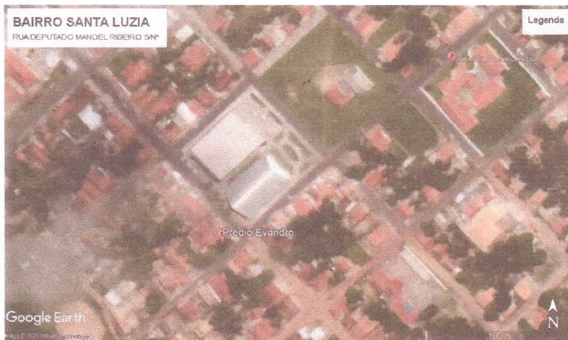
Figura 1 vista área do imóvel

Endereço: Rua Deputado Manoel Ribeiro, S/Nº, Bairro Santa Luzia, Carutapera - Ma