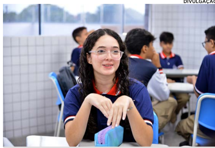
As inscrições para os processos seletivos da Escola Sesi Caxias estão abertas de 22 de outubro a 13 de novembro de 2024

As vagas gratuitas são destinadas a alunos de baixa renda, conforme os critérios estabelecidos pela proposição nº 34, aprovada pelo Conselho Regional do Sesi/MA. Os cursos oferecidos incluem o Itinerário de Formação Técnica e Profissional em Desenvolvimento de Sistemas, com 15 vagas no turno vespertino, o Itinerário Formativo Integrado nas áreas de Ciências da Natureza e suas